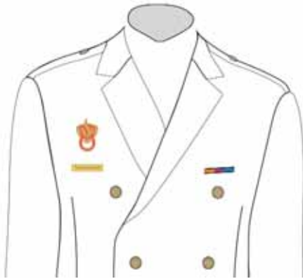
plaats van korpsbrevet, naamplaatje en onderscheidingen

Het korpsbrevet wordt gedragen op het colbert, de parka en de blouson, op de daarvoor aangegeven, voorbereekte plaats (rechterborst).