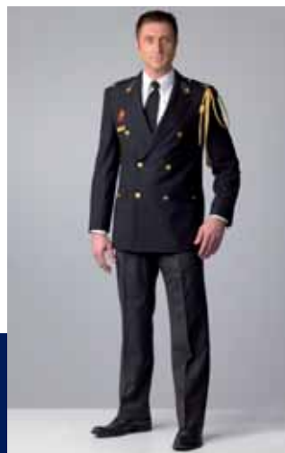
ceremonieel uniform binnen