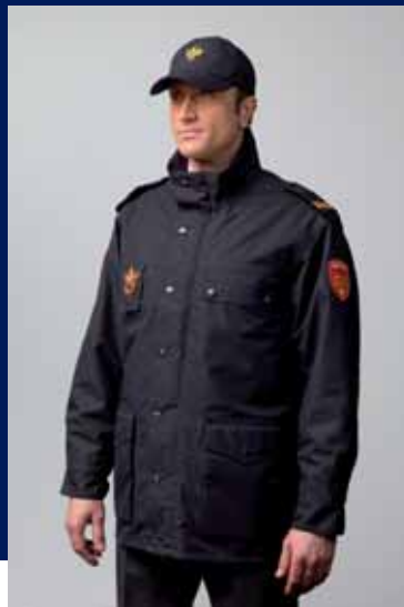
cap en parka