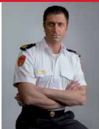
overhemd korte mouw