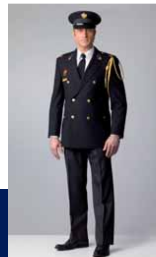
ceremonieel uniform buiten