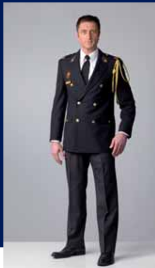
ceremonieel uniform binnen