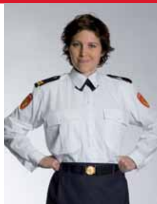
overhemd lange mouw