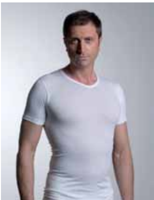
T-shirt ronde hals