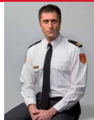
overhemd lange mouw