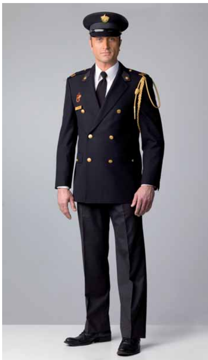
ceremonieel uniform buiten