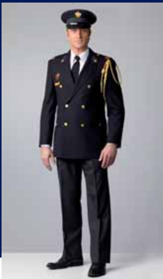
ceremonieel uniform buiten

NB alleen dragers dragen witte handschoenen.