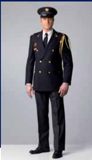
ceremonieel uniform buiten